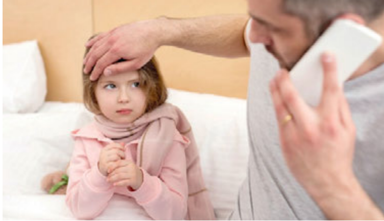
Le service téléconsultation est simple, sécurité et confidentiel.