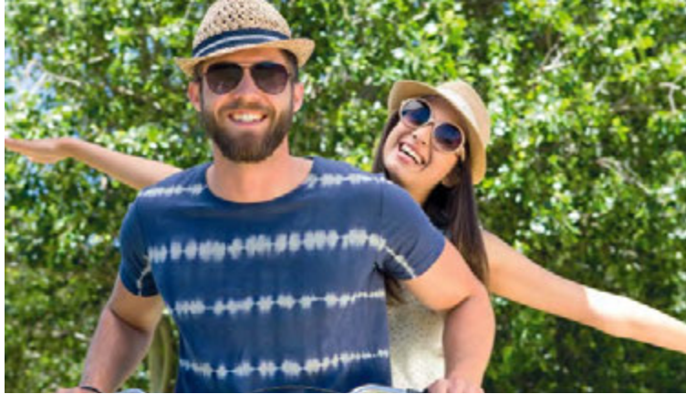
Protégez vos yeux des effets néfastes du soleil.