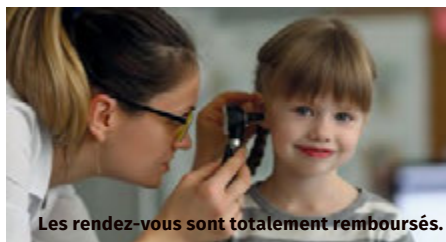
Les rendez-vous sont totalement remboursés.

Ces examens permettent de faire le point sur le développement de l'enfant et de réaliser les vaccinations. Ils peuvent être effectués par un généraliste, un pédiatre libéral, dans un centre de santé et, jusqu'à l'âge de 6 ans, dans un service de protection maternelle infantile (PMI).